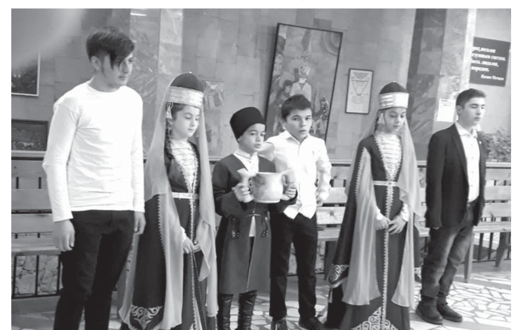
3-чю номерли мектепни окъуучулары.