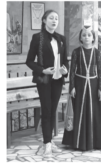
Лёлокаланы Малика бла Гемуланы Милана.