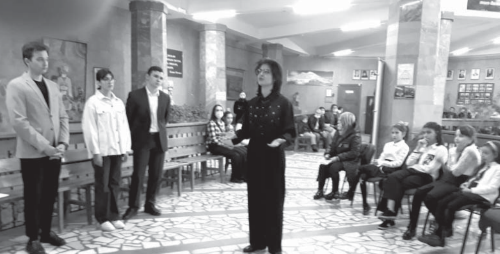
Уллу поэтни назмуларын малкъар, къабарты, орус тилдеде кезиу-кезиу айтхандыла. Школчу сабийле аны тилде ариу сөлешгенлерине, назмуланы шатык окъугъан