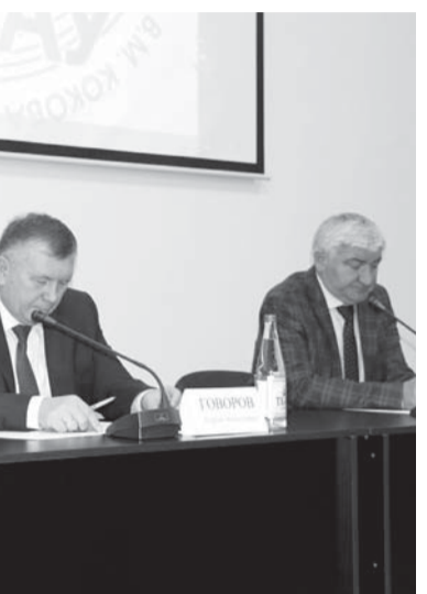
Тюбешуно ахырында форумгъа кыатышханла, жаш депутатла да экспертлеге соурула бергендиле, тынгылы жууапла да эшитгендиле. Ызы бла «Социальное проектирование, как вид проявления молодёжи в селе» деген мастер-класс-тренинг болганды, биринчи номерли дискуссиялы майданны ишини эсеплери да сюзюлгендиле.

ан студенттерибизни окуяна да ишге чакырадыла. Алай бла 128 организация бла келишим да этгенбиз. Элни жашауу бла байламлы ишлеген жууалпы бѐлюмде бла кыаты байламлыла турургъа керекбиз»,-деп белгилегенди проректор.