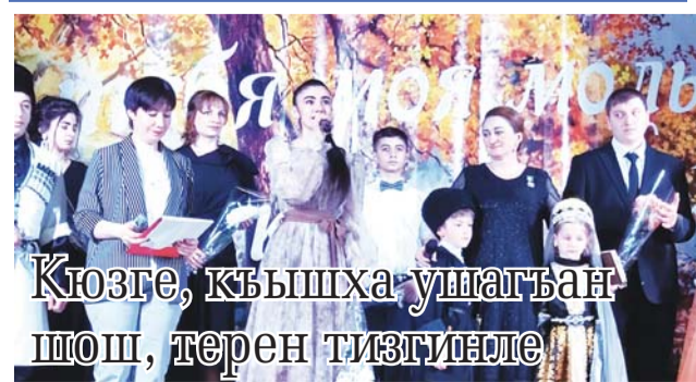
Кюзге, къышха ушагъан шош, терен тизгинде