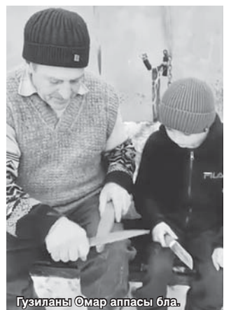
Гузиланы @мар аппасы бла.

Эсселе эришиуню жорукъларында жазылган мардалада тюшгенди жюрины кюлуна. Аны кыауумунда уа артистле, жазычула, аллимле, режиссерла да болгъандыла. Ала сабийлени тилин билгенлерине, тизгинлиликлерине, кеслерин