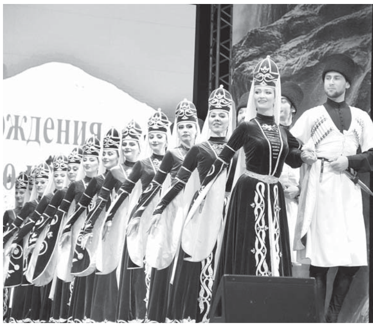
Байрамга аталгъан материаланы 2,3-чю бетледе окъугъуз.

Малкъар халкъны жашаууна, айныу жолуна аталып тематика ингрле, тюбешиле, сурат кёрмючле, спорт эришиуле бардырылгъандыла. Бюгюн биз аланы бир къауумундан халпарла билдиребиз.