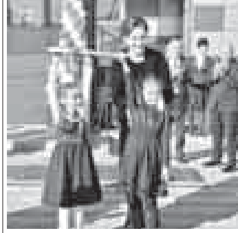
Тивни жартысы эр кишиле болганларын айтыргга сюеме, аны хайырындан а нызам да кючлюдо, бир тюрлю кьаугга, даулаш да болмаучуду, сабийле уа алагга бек тулгаладыла», -дегенди ол.