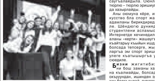
тюртюно номерли гимназияны бошганды. Биринчи курсда практикадан сора башланган класслада устаз болугга сюйгенин анылганды. Таукел кьыз сезюне кертичи бола биледи, башхаладан да аны излейди. Биринчи конледен окуна студентлени араларында алчы болганы, сезю барганы кьериюну кьылгань эди.