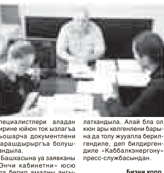
специалистлери аладан биринчи ююно ток ызлагыа кюшулууну, электрокоч бла жалчытыууна кючтосууну, тейлеуну, токну эсеплеуну юсюнден толукрак билриге излегендиле. Компанияны

Бу жол Терек, Нарткъала, Майский, Тырысуз шахарладан, Баксанёнок Дыгулыбейгь эм Огъары Жемтала эпледен келгенлени асламысы ток ызлагыа кюшулууну, электрокоч бла жалчытыууна кючтосууну, тейлеуну, токну эсеплеуну юсюнден толукрак билриге излегендиле. Компанияны