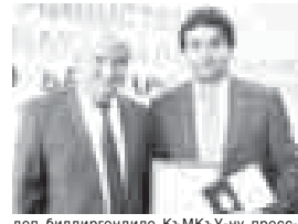
деп билдиргенди КъМКЪУ-ну пресслужбасында. Бизни корр.