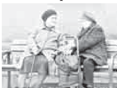
(Башхача айтканда, сизни иш бла жалчыхтан организация Пенсия фондах төлеуени этдорон турган кезиу) азындан 15 жыл болурга керекди.

Бу жоруккы актырын-актырын кийиреди. 2017 жылда страховый пенсияны алыр ючюн 8 жыл ишлерге керек болуккыду, 2018 жылда - 9 жыл, 2019 жылда - 10 жыл эм андан ары да, алай эте, бирер жыл кыюула барлыккыду. 2025 жылда уа ол 15 жылгы дери жетеркиди.