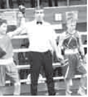
асламы жаш тейю разрядны биринчи эм экинчи нормативин топургандыла. Биринчи жерлени алгына уа Россияни майда Анапада бардырылыккы