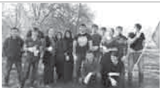
Табийгатха улуу заран тюшюреди.

Россей Федерацияны Президенти Владимир Путини онуу бла Байыл Экологияны жылча бардырылды. Кырчак-малкыр жаш тейюну айнууна себептик этген «Эльбрусид» фонд да бу кюнледе «Таза шахар» деген эстафетаны ачканды. Аны хайрыра бла адамланы тууган жерибизге сак болурга, жашаган жерлерин киргиз турарга чакырыганды. Тазалык, бек биринчиден, кесибини саулугубузга иги болганын да белгилегенде. Бу жумушну Канкуев атлы орамдан башлагандыла. Анда суу жагысында солурга суйгөнле кендуле. Алай кесирини ызырдан кылган-кылганын чачып кетгенле, жарыгуула, асламдыла. Шешаланы, пластмасса адырланы сууга да сыздыла. Ол а