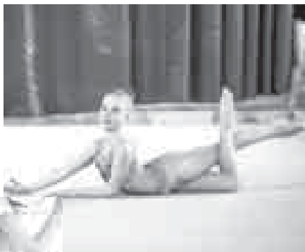
Малика эришулени кезиунде.

берген 30-чю номерли мектебинде эм Лондон-Экспресс школда айырмалы окуйду. Инглиз тилден, математикадан да конкурслагъа къатышхан-