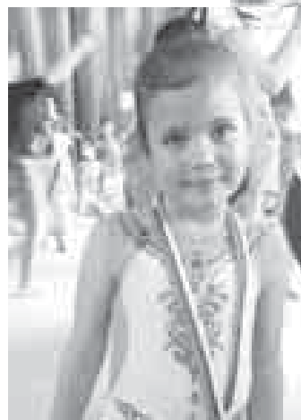
Амира саугъасы бла.

Къызчыкъ, жаланда спортда жетишимли болуп къалмай, Пятигорск математикадан терен билим