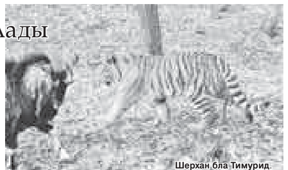
Шерхан бла Тимурид.

- Ахырысы бла да бир бирлерине ушамагъан жаныуарла