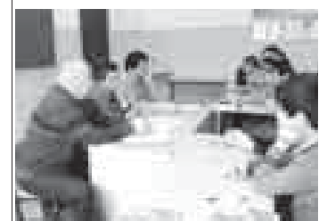
Бизни корр. Суратда: туюбешюуно кезиюунде.

Бу кюнде Черек районь Герегек элини орта шолуида окугьанла бла болгьан туюбешюуде терроризмин, экстремизмин, наркоманияны, коррупцияны эмда миллетени араларында байламлыкьланы профилакьтасыны оюсонден баргьанды сьз. Ол тийрени жер-жерли администрациясы башлам-чылыгы бла куралгьанды. Туюбешюу чертилип айтылгьанды. Терроризм а билеу адам улугьа къоркьуу салгьаны ол келюле баргьаны да билюленгендиле. Жаш адамла ны дини экстремизмге тартуу Интернетни юсю бла, башка амалла бла да бардырылгьаны энсегрип, ата-анала бла устала сабийлени къылыкьларна кьорюксэ бурбурга, ала бла селширге, огурулу ниетлеге, аманын игиден