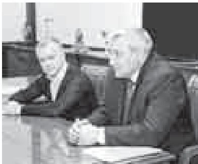
либден магъаданы кызып эмда жарашдырып башлауну проектинге анга сейрлеры болгъан организацияла бла бирге энтта да кыайтар кырагъа, кыоранчларын тергерге эмда оюмларын билдирдирге буюргъан эди.

Сизиге салайкы: 2016 жылда ноябрьде Россейни Президенти В.В. Путин РФ-ни Правительствосуна Тырнауузда вольфрам-мо-