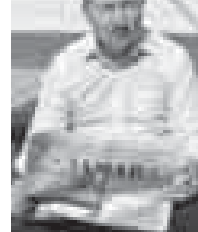
АТАБИЙЛЫНИ Сагъыт. Нальчик шахар.

ангылатама. Аны хайырыдан туудукълары аны тиллеринде аруу, шакъ сѣлешдиле. Къайсы тили да билген игиди, алай адам бек алгъа ёз тилин билдирге тийишди. Бу ишге «Заман» газетибиз улуу себеплик этеди. Ол шахарда, сабийлеге окъутуп турганма. Ала ёсди, юкдегили болды. Аллында ахшылыгъандан, туудукъла да бар. Тамата шолгъа барды. Окъуй, жазса биледи. Энди уа газетни анга окъутам, гитчеле уа тынгылайдыла. Билмеген сѣзлерин