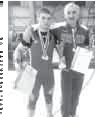
«Луч» кючлюрек эди. Алай мен бизничилини да махтаргьа суюем», - дегенди.

Апрель айда «Спартак» командабыз эки матч бардыргьанды. Биринчисинде ол хорлагьанды. Экинчисини а теге эсеп бла бошагьанды. Алай бла, алгьа нальчикчине «Нефттехимик» бла ойнагьандыла эм 1:0 эсеп бла алыч болгьандыла. Тышында туюбешюуде бир бири эзындан ол керек къытыдыргьанларындан сора бу хорлам бютюн уллу магьананы тутханды. Футболчула, къараучула да кёл этдиргенди. Ызы бла спартакчыла Владивостокну «Луч» окуна этгендиле, жеуленген сары карточкада да беригендиле. Болсада къазуачылыны ол да тыймагьанды. Бир кесекден аланы келечилери, спартакчыны кийиминден хыны тутуп, чабыуулун ахырында дери жедирге къоймагьанды. Алай судья аны эселемген чамы этгенди огьесе кертиси бла да кермегенмиди, алай майдандан а къыстамагьанды. Экинчи таймда спартакчыла эс жыйгьандыла, жангы, алыкъа арымагьан футболчула да чыкьгьандыла.