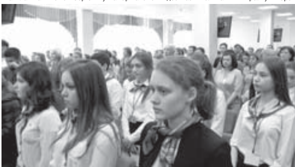
Ахыры 2-чи бетдеди.

«Строймаш» предпритияла саулай къыралда окъуна жокуну орунундадыла. Бу производствону къурау бек магъаналы болгъанды. Бир юннеге заводда эки мингге жууукъ бетон чыпын чыгарарды-