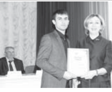
«Достоинный труд» основна байлосостояния чеге