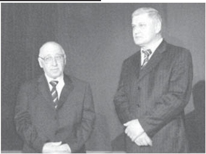
Тёппеланы Алим бла.

«Малкъар театрда бир тогуз жыл ишлеген болур эдим, теири. Рольларымы, усталыгъымы да жаратып турганма. Бир кезиуде уа, билемсиз, бир зат жет-