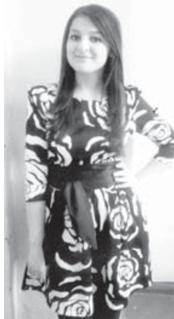
мат жюрексинип жиягъанын адам унутмас.

Январь айны 24-сю эди. Аида дерслерин эте турганлай, телефону зынгырайды. Ол анга тынгылап: «Амма, бусагъат кѳайтып келейим», - деп, телефонун да юйде кѳоюп, тышына чыгады. Эки сагъат озгъунчу уа, ачы хапар жетеди. Ногмов атлы орамда уллу юйлени кѳатында кѳызны ёлюп турганлай табадыла. Ол кюнню эсине тюшюрюп, кѳарт кѳатын Фати-