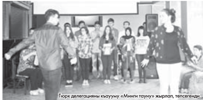
Тюрк делегацияны кыууу «Минги тауну» жырлап, тепсенди.

Лагерни жабылууна тыш кыаралы ата журтларыбыз сейирлик концерт программа кыурагандыла. Тюркден келгенле «Минги тауну» орус эм малкыар тилдеде жырлагандыла, тепсенге да этгенди. Моздокчу къабартылыла ана тиллеринде