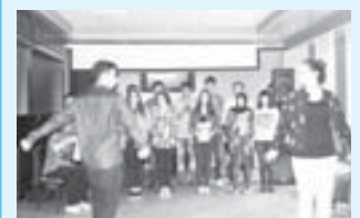
Жюреклеге унутулмазча тюрлю тюрлю такыйкъала