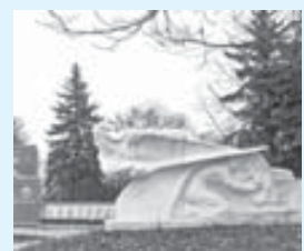
Элиле жигитлерини сыйларын кёредиле