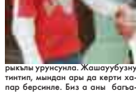
рыклы урунсума. Жашуубузу тинти, мынд аны да керти хар бир берсинде. Биз оры багъа-

Мен Гуртуланы Аликме. Акъ-Сууда жойыма. Азиядан кыйтыкханы бергиз тилимизде чакъын газетни жаздырма туралмайма. Башындан аягына дерни окъудай да кыймаймы.