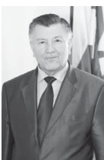
Аныр 2-чи беттеди.

5. Бу Указ аны кал салынгандан кюнден кючюне киреди.