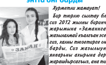
Хурметли жамауат! Бир торлю сылтау бла сиз 2012 жылны биринчи жарымына «Заманга» жазыламай къалгандан эсегиз, халны тюзетирге онг барды. Сиз жазылууну январьны ахырына деру жарашдыргасыз, аны тилбизде чыггандан газет-бизни 7-чи февралдан алып башыркысыз. Беш айга жазылууну багасы 296 сом 75 капекди.

«Заман» газетни редколлегиясы. Бизни индексибиз - 51532