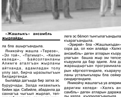
«Жашлык» ансамбль жырлайды.