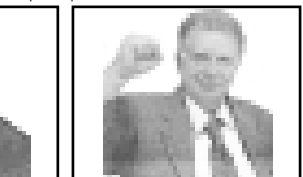
Жорес АЛФЕВОВ, академик, РГН-ни вице-президенти, Нобель сьуданы лауреаты, Кьырал Думаны депутаты