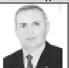
БАДКЕВ Исмаел Абдул-Газизович, КПРФ-ни АК-сыны члени, Кьырал-Черкес Республиканы Парламентини депутаты