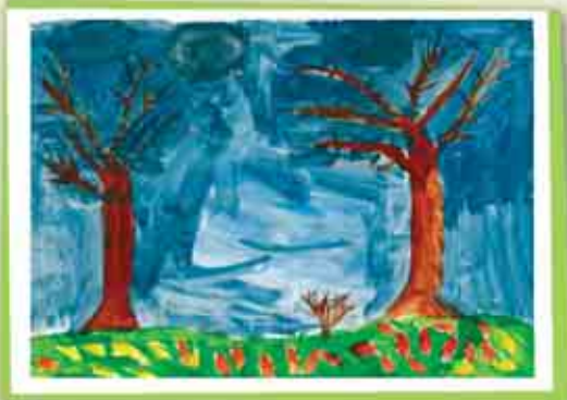
Рауль ЭЛЬБАЕВ, 4-й кл., прогимназия № 18, г. Нальчик