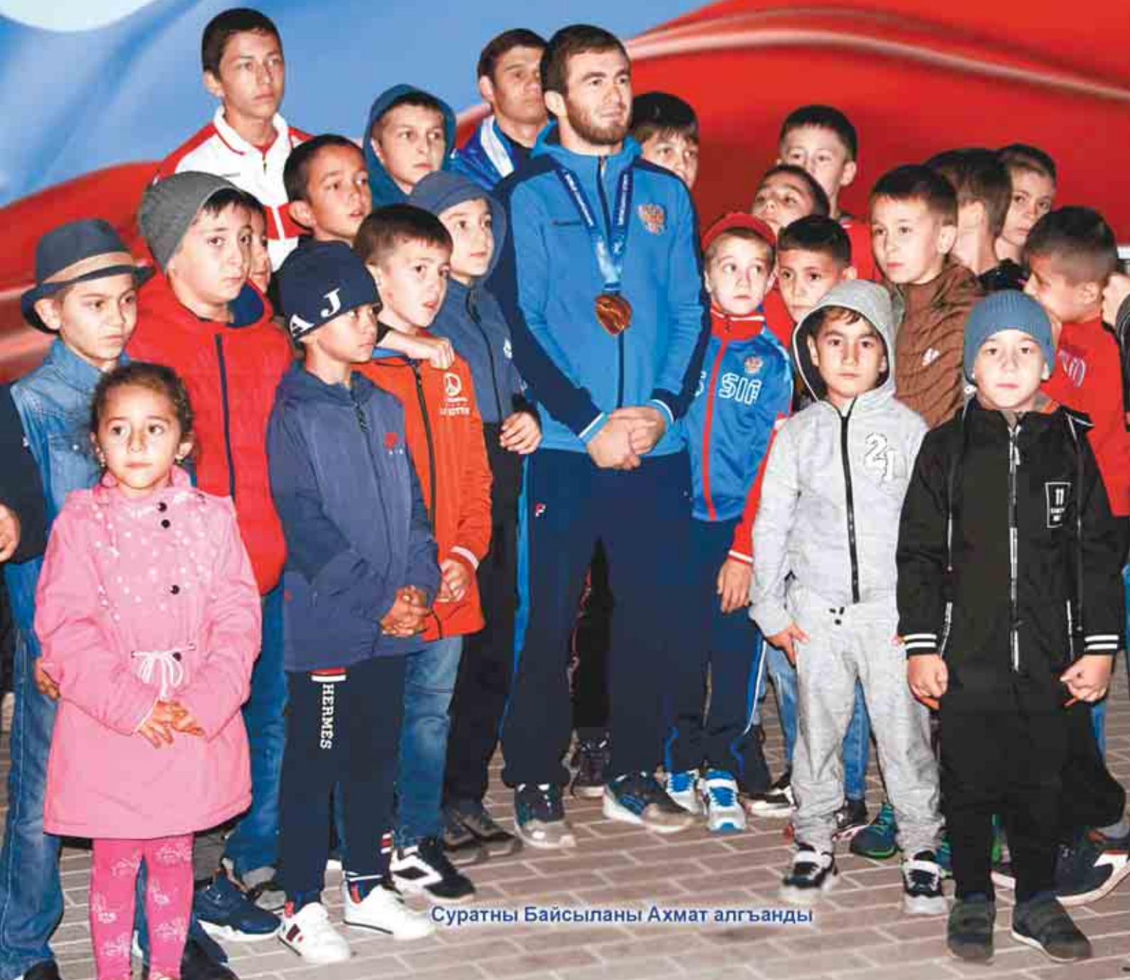
Суратны Байсыланы Ахмат алгъанды