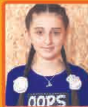
Кузца Милана, Сэрмакъ къу., СОШ № 2