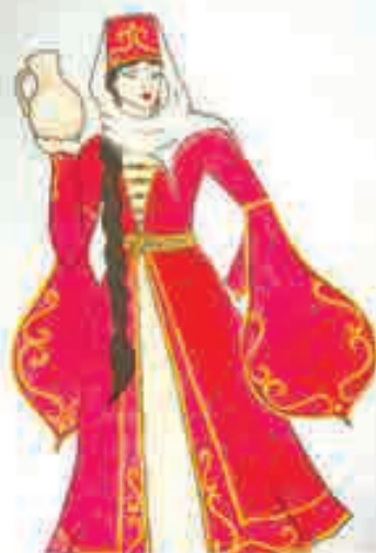
Борсэ Алинэ, Налшык къ., 4-нэ Гимназиэ, 3 кл.