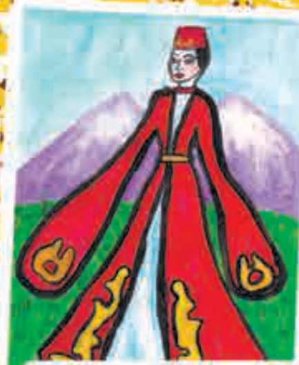
Инжыжокъуэ Аминэ, Налшык къ., 4-нэ Гимназиэ, 4 кл.