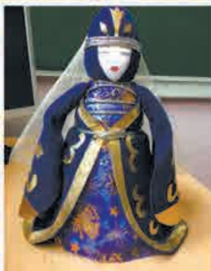
Тхъэкъуахъуэ Атмир, Налшык къ., 4-нэ Гимназиэ, 3 кл.