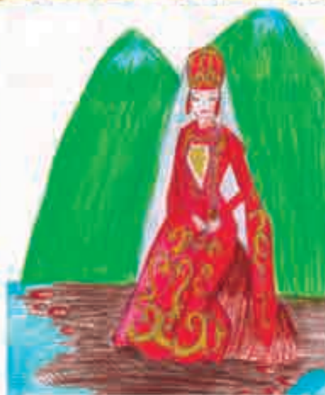
Ету Арабеллэ, Налшык къ., 5-нэ курыт еджаплэ, 7 кл.