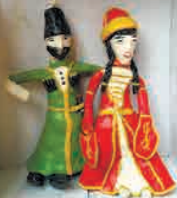
Сомгъур Шамхъан, Налшык къ., 4-нэ Гимназиэ, 3 кл.