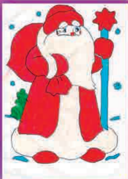
БЕКЪУЛ Миланэ , 2-нэ еджапIэ, Сэрмакь кьу.