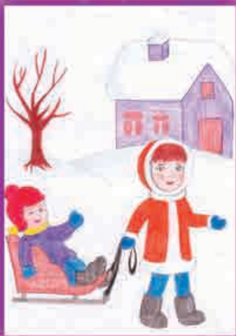
КЪЭЛЭЖЬОКЪУЭ Ларинэ, 1-нэ еджапIэ, Къармэхъэблэ къу.