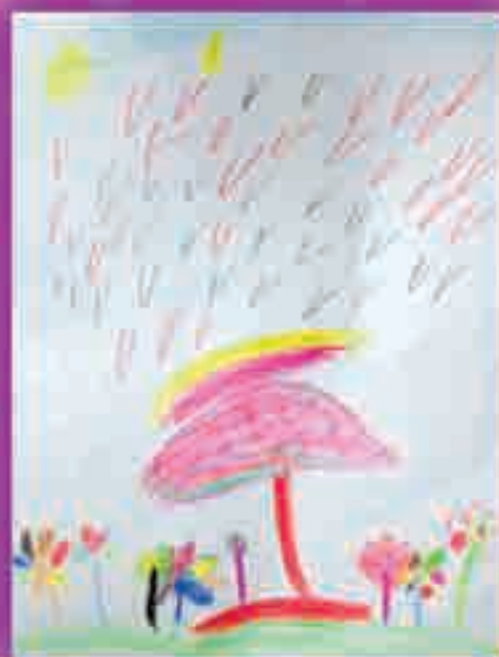
ГЫНДЫГЪУ Камилэ, 2-нэ сабий сад, Дзэлыкъуэкъуажэ.