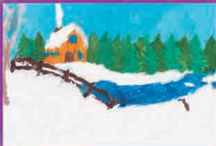
БЕКЪАН Самирэ , 27-нэ еджапIэ, Напшык кьу.