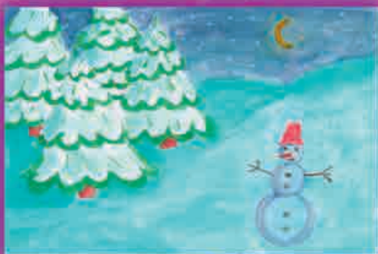
МОЛЭ Ислъам , 3-нэ еджапIэ, ХъэтIохъушыкъуей къу.