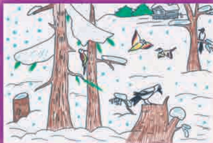
ДОКЪУШОКЪУЭ Лаурэ, 2-нэ еджапIэ, Сэрмакъ къу.