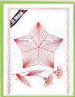
Шабнам ЛАТИФОВА, 4 кл., т/о «Азбука моды», ДАТ «Солнечный город», г. Нальчик