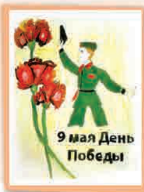
София АСТАФУРОВА, 3 кл., т/о «Умелец», ДАТ «Солнечный город», г. Нальчик