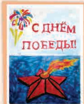
Фатима ШАКОВА, 4 кл., т/о «Умелец», ДАТ «Солнечный город», г. Нальчик