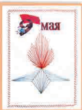
Аделина ЛУКОЖЕВА, 5 кл., т/о «Азбука моды», ДАТ «Солнечный город», г. Нальчик