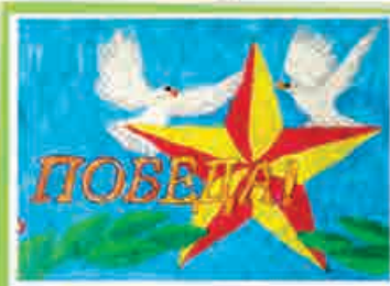
Фатима ЛИХОВА, 4 кл., т/о «Умелец», ДАТ «Солнечный город», г. Нальчик