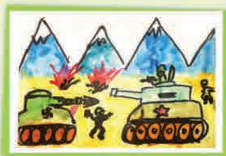
Ислам АБАНОКОВ, 1 кл., т/о «Самodelкин», ДАТ «Солнечный город», г. Нальчик