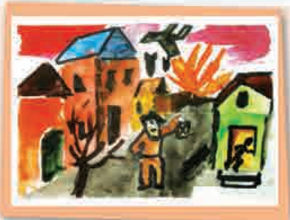
Рамазан СЕРГЕЕВ, 2 кл., т/о «Самodelкин», ДАТ «Солнечный город», г. Нальчик