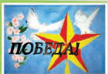
Амалия АРИПШЕВА, 3 кл., т/о «Умелец», ДАТ «Солнечный город», г. Нальчик