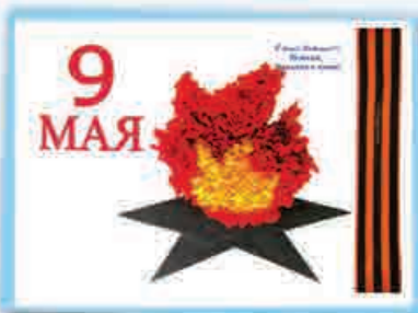
Элина КАРАШАЕВА, 4 кл., т/о «Азбука моды», ДАТ «Солнечный город», г. Нальчик