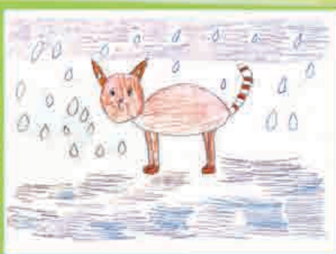
Лаура КАРДАНОВА, 1 «Г» кл., СОШ № 9, г. Нальчик