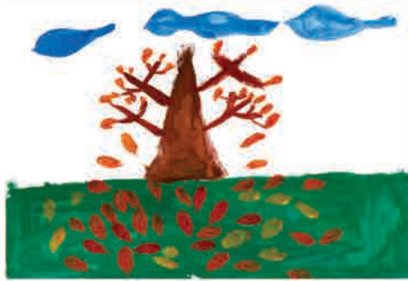
Рауль ЭЛЬБАЕВ, 2-й кл., прогимназия № 18, г. Нальчик