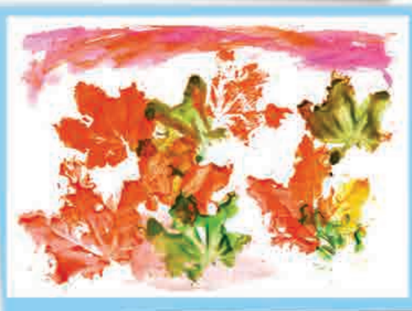
Амелия КАРИЦКАЯ, 2-й кл., СОШ № 27, г. Нальчик