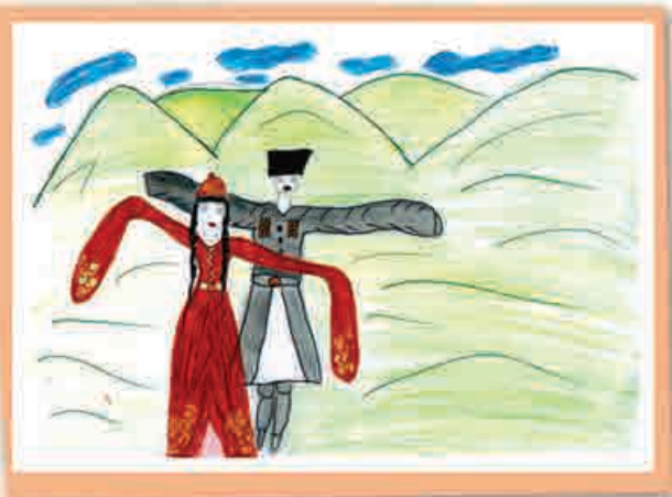
Осман ВОРОКОВ, 2-й кл., СОШ № 27, г. Нальчик