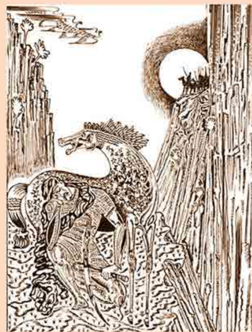
Иллюстрации к поэме Шота Руставели «Витязь в тигровой шкуре»