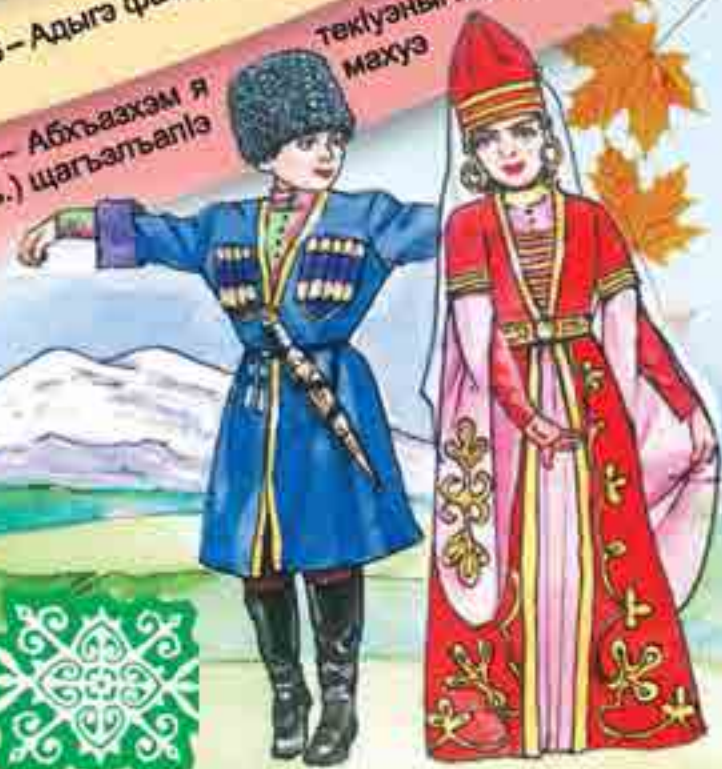
30 – Абхъазхэм я гъ.) шрагъэльтыпэ техуэныгъэр (1993 махуэ