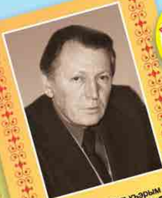
23 – Къэбэрдей-Балькъэрым и Цыху- бэ усакуэ ТХЪЭГЪЭЗИТ ЗУБЕР къы- щальхуа махуэ.