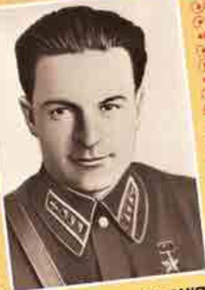
2 – Кхъухьтыатзэхуэ КЪАНКЪУЭЩ Ахьмадхъан къыфцашщ Совет Союзым и Лыхъужь цэ тыплэр (1943 гь.)