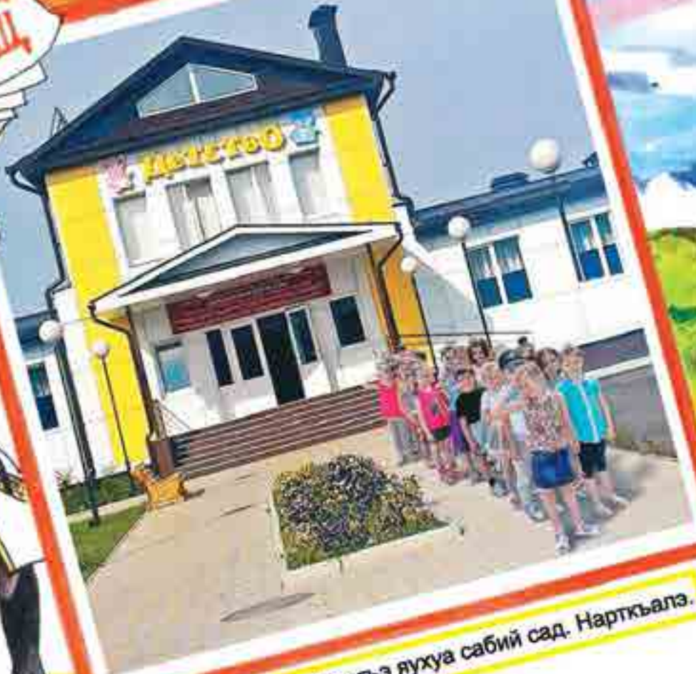
Иджыблагыэ яухуа сабий сад. Нарткьалэ.